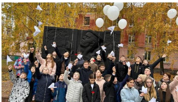
Праздник «Журавли Победы»