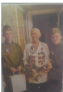
Фото - отчет работы воспитателей детского дома «Единства».