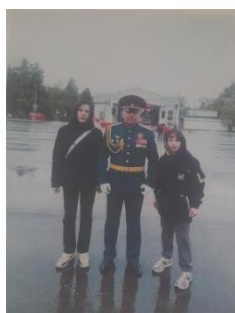
Встреча с ветеранами.